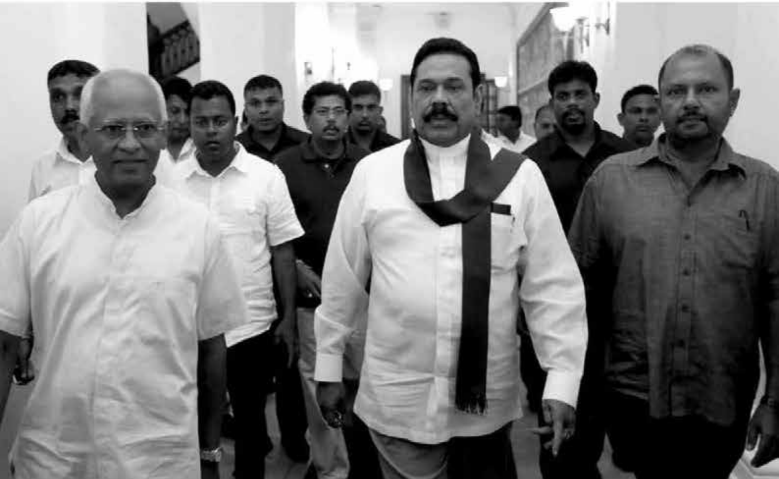
වනචාර දඬකයක නිමාව...

17. කොන්ත්‍රාත්කරුවන්ගෙන් කොමිස් මුදල් ලබා ගෙන 2015-03-17 දින විදේශ සංචාරයක නිරත වී තිබේ.