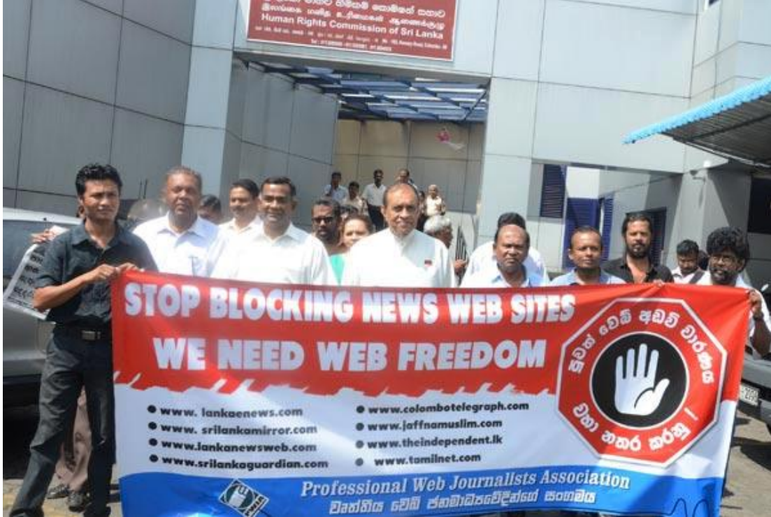
NHRC-SLக்கு மனுவைச் சமர்ப்பித்த பின்னர் புகைப்படமொன்றுக்கு இதழியலாளர்களும், எதிர்க்கட்சி அரசியல்வாதிகளும் முகங்கொடுக்கின்றனர்