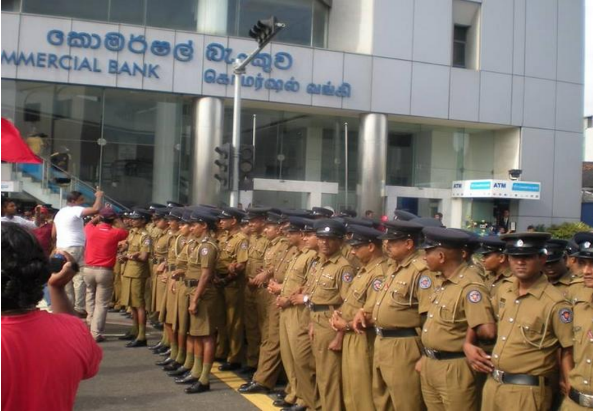
கொம்பனித்தெரு சந்தியில் இணைந்த தொழிற்சங்க கூட்டணியின் மே தின போராட்டத்தை பொலிஸ் தடைசெய்தது