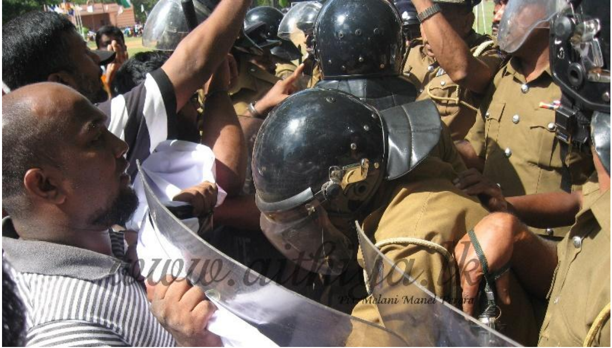
2014 ஓகஸ்ட் 30 அன்று அமைதியான போராட்டங்களை பொலிசார் தடுத்தனர்