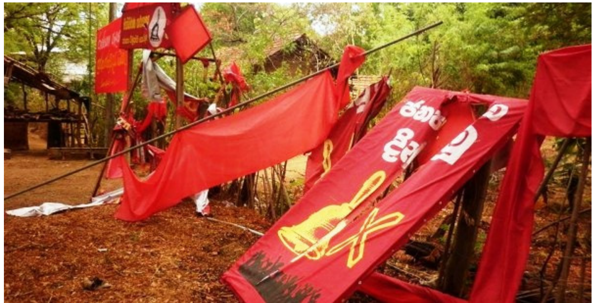
ජනතා විමුක්ති පෙරමුණේ මැතිවරණ ප්‍රචාරක කාර්යාල ගණනාවක් ප්‍රහාරයන්ට ලක් වී විනාශ විය

2014 සැප්තැම්බර් 20 වන දින ඌව පළාත් සභා මැතිවරණය පැවැත්විණි. පළ වූ විවිධ වාර්ථා වලට අනුව විපක්ෂයේ මැතිවරණ ප්‍රචාරණ කාර්යාල 50කට පමණ ප්‍රහාර එල්ල වී ඇත. "විපක්ෂ කාර්යාල වලට ගිණි තබා අවි ගත් මැර කණ්ඩායම් ඒවායින් පිටවී ගිය බව" වාර්ථා වූ බව කැලේ ආයතනයේ විධායක අධ්‍යක්ෂ කීර්ති තෙන්නකෝන් මහතා ජර්නලයේ කළේය. රාත්‍රී කාලයේ ගැවසුණු අවි ගත් කණ්ඩායම් හේතුවෙන් ප්‍රදේශයේ ආතතිය වර්ධනය වූ බව ඇතැම් දේශපාලන පක්ෂ වෝදනා කළේය. විපක්ෂයේ දේශපාලන කාර්යාල වලට එල්ල වූ ප්‍රහාර වලටද මෙම කණ්ඩායම වගකිය යුතු බවට වෝදනා එල්ල වූ අතර එක්සත් ජාතික පක්ෂයේ, ජනතා විමුක්ති පෙරමුණේ සහ ප්‍රජාතන්ත්‍රවාදී පක්ෂයේ කාර්යාල ගණනාවට මේ ආකාරයේ ප්‍රහාර එල්ල විය. සිය කාර්යාල 30ක් (සැප් 12 වන විට) ප්‍රහාරයට ලක් වී ඇති බව ජනතා විමුක්ති පෙරමුණට ප්‍රකාශ කළේය. "මෙම පහරදීම් සඳහා රජය බලය සෘජුවම යොදා ගෙන ඇත. වෙඩි තැබීමේ සිදුවීම් 4ක් වාර්තා වී ඇත. කෙසේ වුවත් මේ සම්බන්ධයෙන් කිසිදු පුද්ගලයෙකු අත්තඩංගුවට ගෙන නොමැත. " යනුවෙන් ජනතා විමුක්ති පෙරමුණ ප්‍රකාශ කළේය. "එක්සත් ජනතා සන්ධානයට මොනරාගල දිස්ත්‍රික්කය තුළ මැතිවරණ කාර්යාල 219 යෙදවීමට මැතිවරණ දෙපාර්තමේන්තුව විසින් අවසර ලබා දී ඇති නමුත් පාලක පක්ෂය විසින් කාර්යාල 970ක් පවත්වාගෙන යනු ලැබූ බවත් ඉන් බොහොමයක් හුදෙක් මැතිවරණ ප්‍රචාරණය සඳහා පමණක් ආරම්භ කළ ඒවා බවත් කැලේ ආයතනය ප්‍රකාශ කළේය.