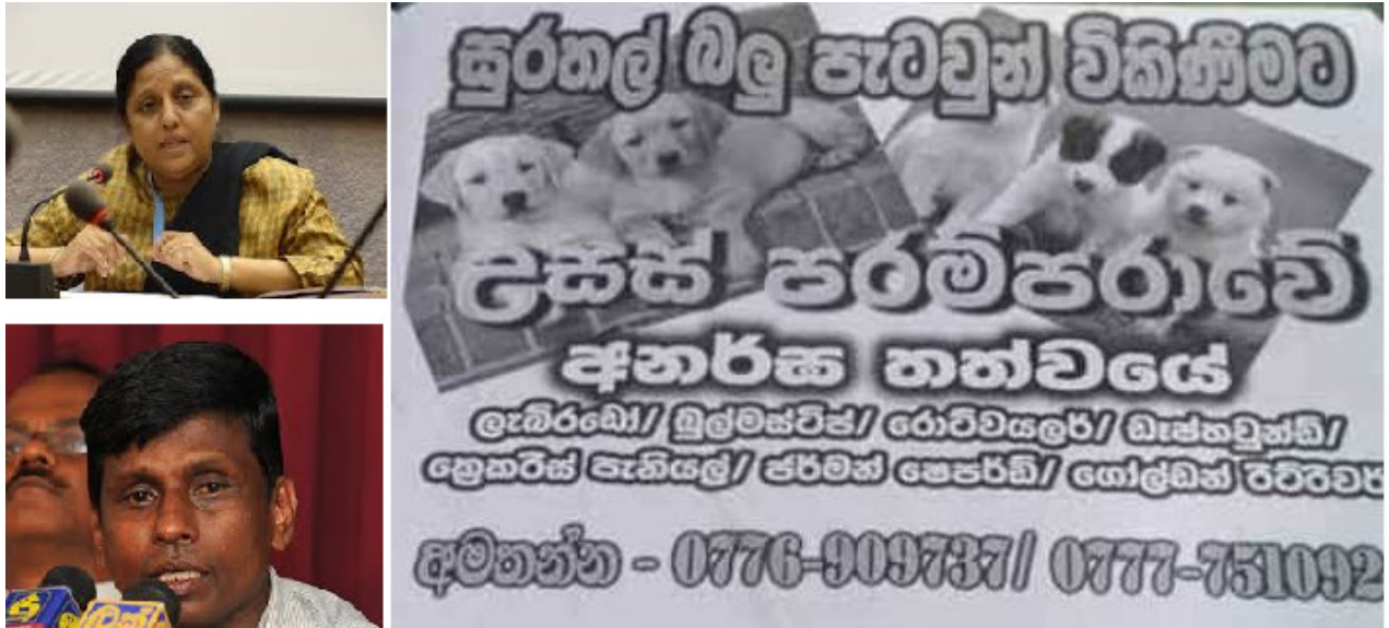
මානව හිමිකම් ආරක්ෂකයින් වන ආචාර්ය නිමල්කා ප්‍රනාන්දු සහ සුනිල් ජයසේකර මහතාගේ දුරකතන අංක ඇතුළත් පෝස්ටරය

http://srilankabrief.org/2014/08/puppies-for-sale-poster-campaign-to-intimidate-hrds/ (අවසන් පිටිසුම් දිනය 2014 සැප් 14)