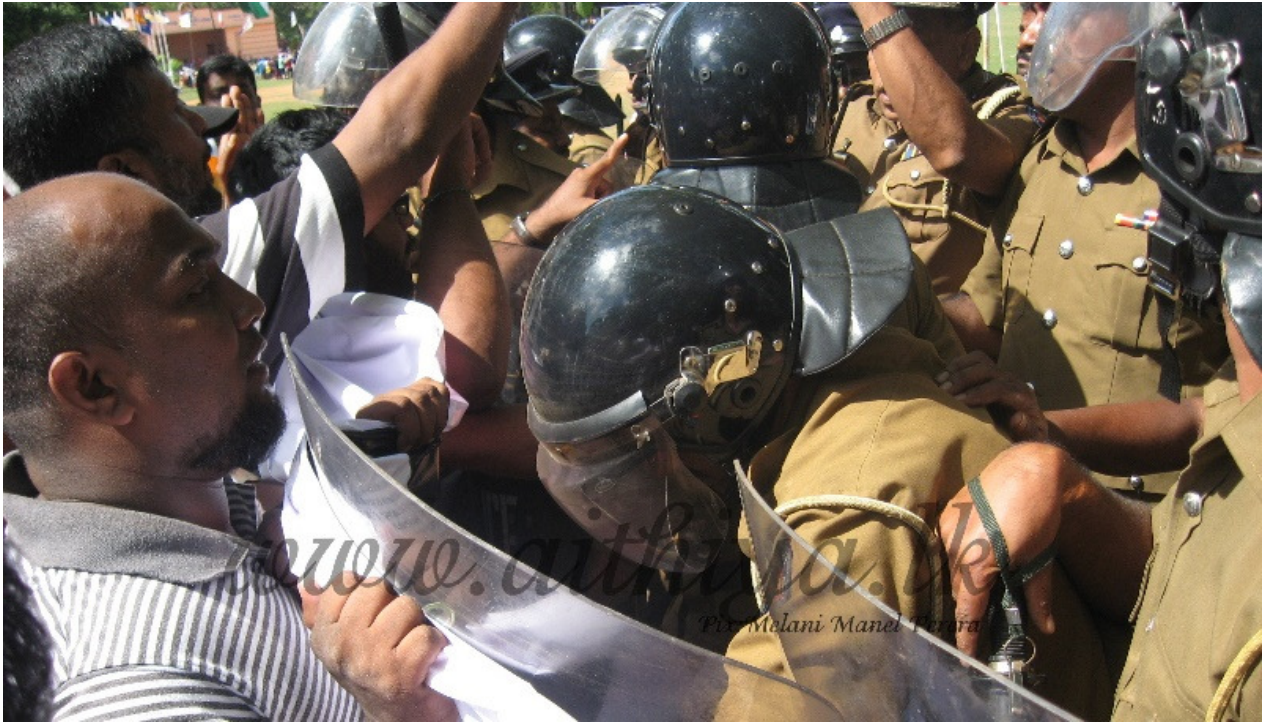
2014 අගෝස්තු 30 වන දින පැවති සාමකාමී රැළිය පොලීසිය විසින් අවහිර කිරීම

අගෝස්තු 14 වන දින අතුරුදහන් වූවන්ගේ පවුල් වල සාමාජිකයන්, විපක්ෂ දේශපාඤ්ඤින්, මානව හිමිකම් ආරක්ෂකයින් සහ පුජ්‍ය පක්ෂය එක්ව රජයේ නියෝජිතයෙකු වෙත පෙන්සමක් භාර දීමට ගමන් කරමින් සිටි රැළිය පොලීසිය විසින් අවහිර කළ බව වාර්තා විය. වවුනියාව නගර සභා ශාලාවේ පැවති මහජන හමුවකින් අනතුරුව මෙම සාමකාමී රැළිය ආරම්භ වී ඇත.