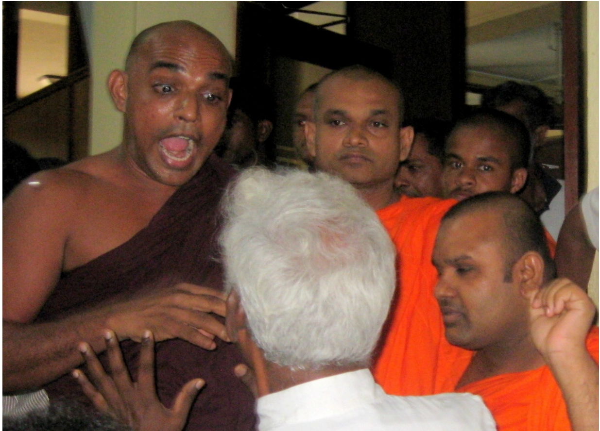
2014 අගෝස්තු 4 වන දින පැවති අතුරුදහන්වූවන්ගේ පවුල් වල හමුවට කඩා වැදී බොද්ධ භික්ෂූන් සතිවේල් පියතුමා වෙත බැණ දින අයුරු.