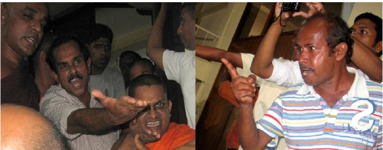
අගෝස්තු 14 වන දින කොළඹදී පැවැත්වුණු අතුරුදහන් වූවන්ගේ පවුල් වල හමුවක් බෞද්ධ භික්ෂූන් විසින් මෙහෙවන ලද මැර කණ්ඩායමක් ආක්‍රමණය කළ අතර එහිදී ඔවුන් වෙරි සහගත සටන්පාට කියමින්, අසත්‍ය චෝදනා ඉදිරිපත් කරමින් අතුරුදහන් වූවන්ගේ පවුල්වල සාමාජිකයන් වෙත තර්ජනාත්මක ස්වරූපයක් පෙන්වමින් හැසිරුණු ආකාරය